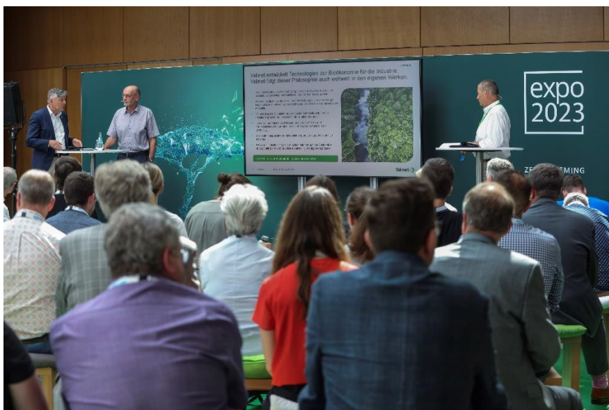
Session Bioökonomie, ZELLCHEMING-Expo 2023